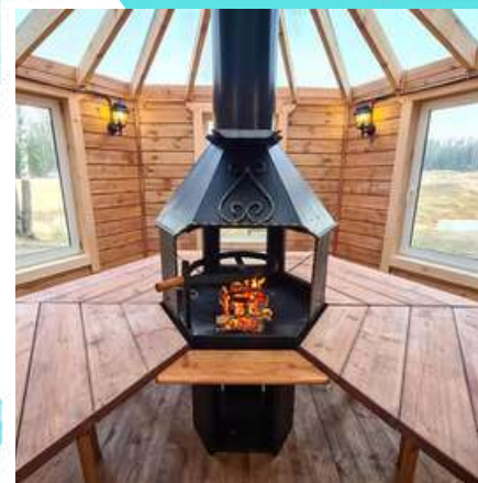
Теплая гриль-беседка №12