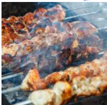
Меню с куриным шашлыком (овощи, соусы, хлеб, 0,5 напиток)