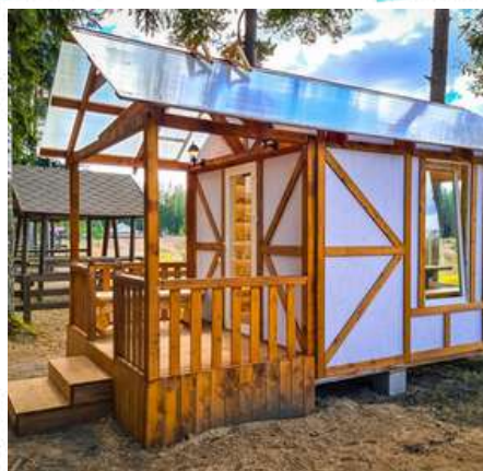
Теплая беседка №46