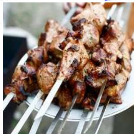
Меню со свиным шашлыком (овощи, соусы, хлеб, 0,5 напиток)

Наши повара специализируются на мангале и шашлыках.