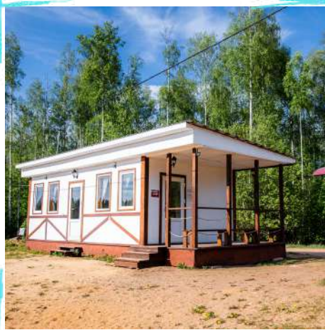
Тёплая беседка № 43