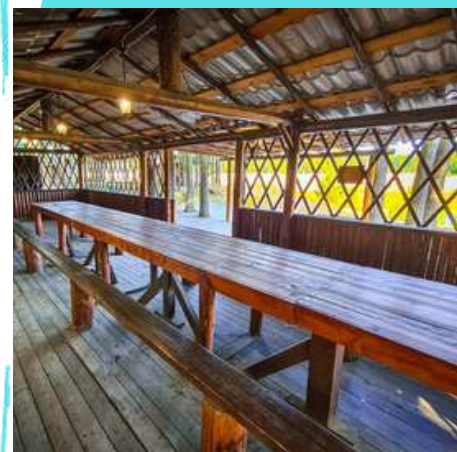
Корпоративная беседка №61