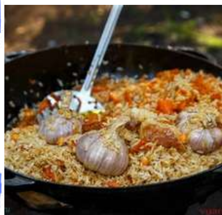
Узбекский плов в казане