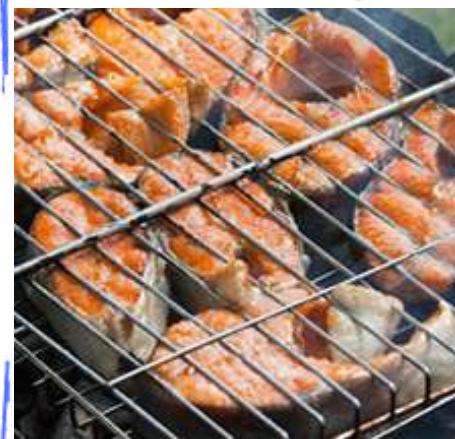
Лосось на мангале (овощи, соусы, хлеб, 0,5 напиток)