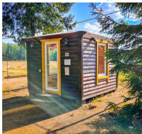
Теплая беседка №20