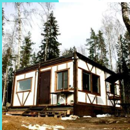
Банкетный домик с террасой №59